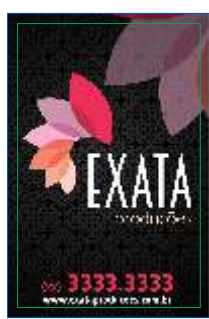
Página 01 Impressão Frente